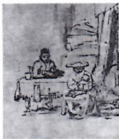
«Santa Famiglia» (1657 ca.) - Riproduzione dell'originale