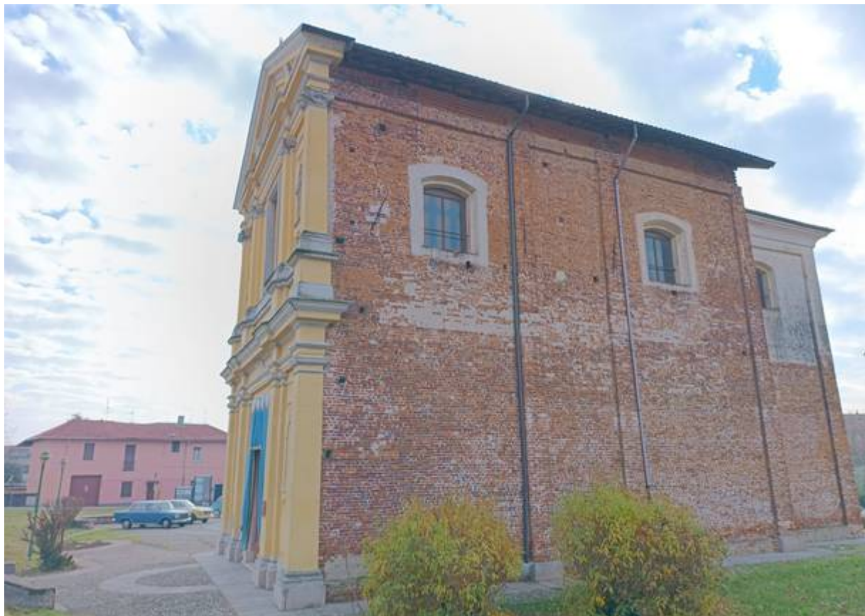
Il santuario della Colorina

In località stazione di Garbagnate Parco delle Groane si usa il sottopasso – attrezzato con rampe per le bici – mentre a Palazzolo Milanese un curioso ponte elicoidale consente di scavalcare il fiume Seveso: i fiume che scendono dal Saronnese e dalla Brianza sono segnati dall'inquinamento, ma non mischiano mai le acque con quelle del Villoresi, che si mantengono trasparenti come alla presa di Panperduto sul Ticino.