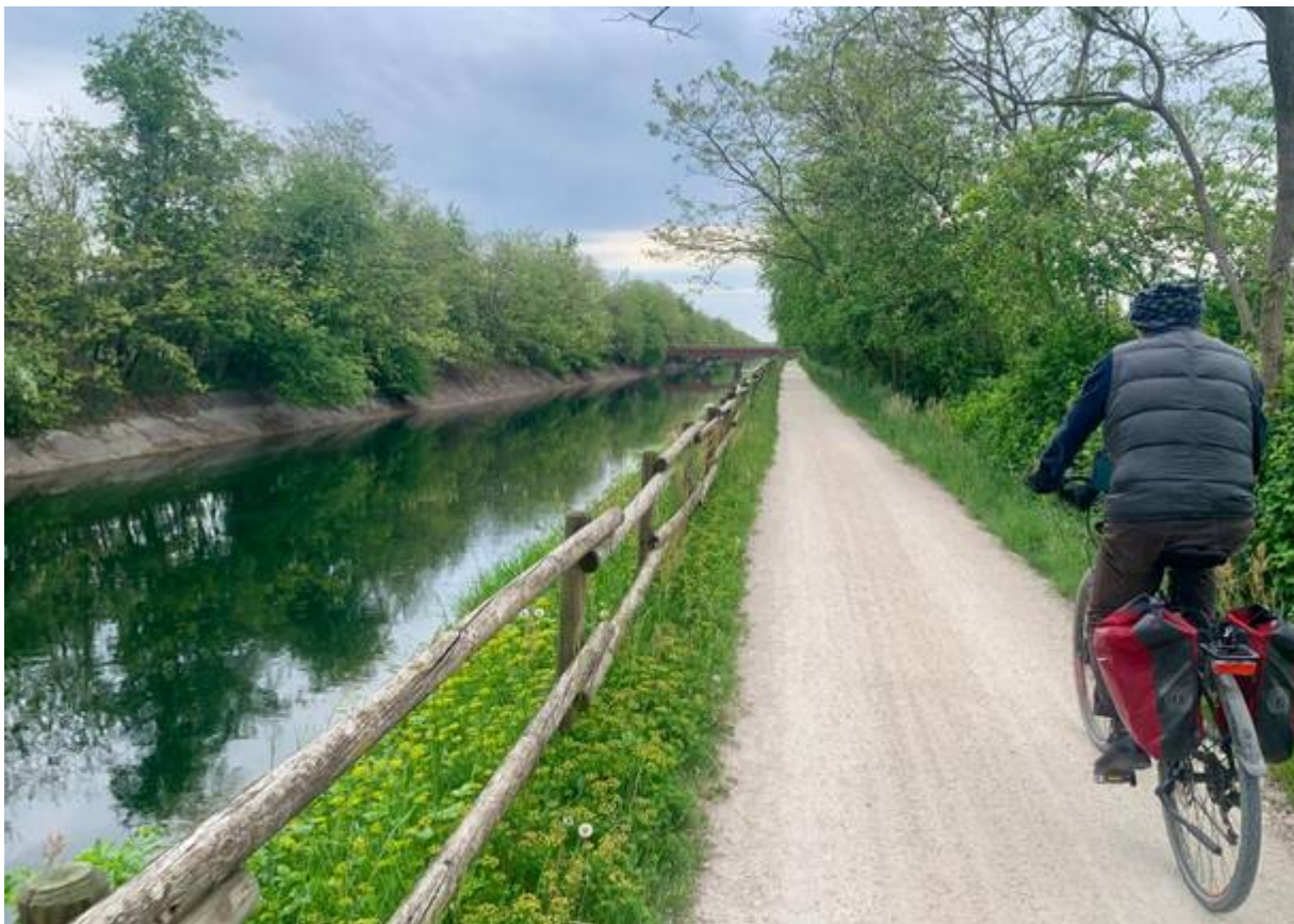
Sulla ciclabile del Villoresi nel tratto vicino a Tornavento

La ciclabile del Villoresi si può prendere sotto Tornavento oppure più avanti all'altezza delle dighe della centrale di Vizzola. L'itinerario protetto segue le acque del Canale Villoresi , un capolavoro ingegneristico di fine Ottocento nato dall'estro di Eugenio Villoresi, per irrigare l'alta pianura lombarda.