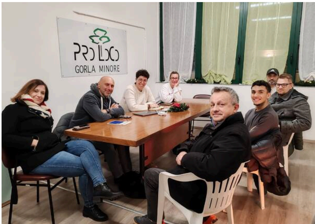
La serata organizzativa dell'evento nella sede di Pro loco Gorla Minore

A impreziosire l'evento anche l'esibizione delle ballerine di Contemporaneamente Danza , che trasformeranno atmosfere e parole in movimenti del corpo e coreografie.