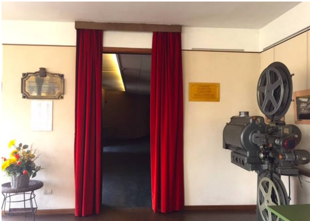
Il cinema Castellani di Azzate

«In questo contesto, le Sale della Comunità – spesso collocate in aree dove l’offerta commerciale è meno capillare – possono rafforzare ulteriormente il loro ruolo: non solo come “luoghi di programmazione” , ma come spazi di educazione all’immagine, incontro tra generazioni, dialogo con scuole e associazioni , e valorizzazione del cinema italiano che nel 2025 ha dimostrato di saper trainare la domanda quando sostenuto da un’offerta forte e riconoscibile.»