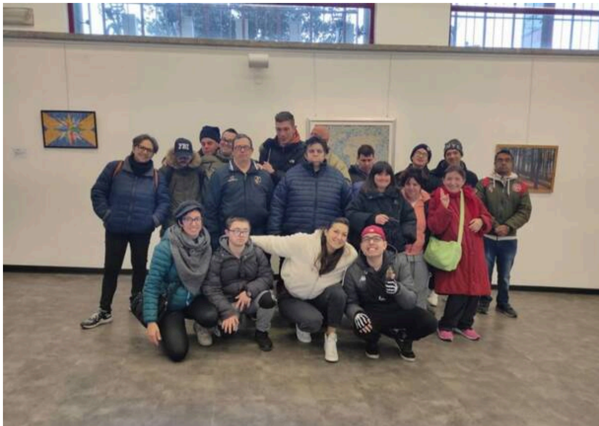
I ragazzi della cooperativa sociale Gruppo Amicizia

Un'occasione d'oro, di scambio e di crescita, che inizierà a gennaio e che, per essere concretamente attivata, ha anche bisogno di tutto il sostegno possibile. Per questo è stata organizzata una cena, che si terrà il prossimo 19 ottobre al Collegio Rotondi.