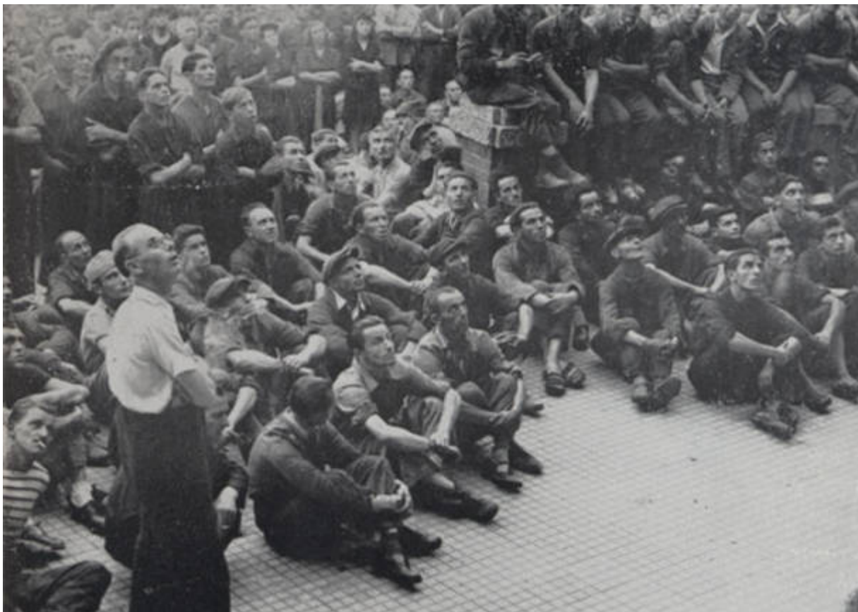
Operai in sciopero alla Breda di Sesto San Giovanni, primi giorni di marzo 1944

Il 4 marzo a Busto Arsizio (dove a gennaio erano stati deportati gli operai della Comerio), Gallarate e Sesto Calende le minacce dei fascisti ottengono la ripresa del lavoro, ma Saronno non si piega : 70 operai vengono arrestati, alla De Angeli Frua i nazifascisti arrestano tutti i maschi (venti, in totale) ma le donne non si arrendono.