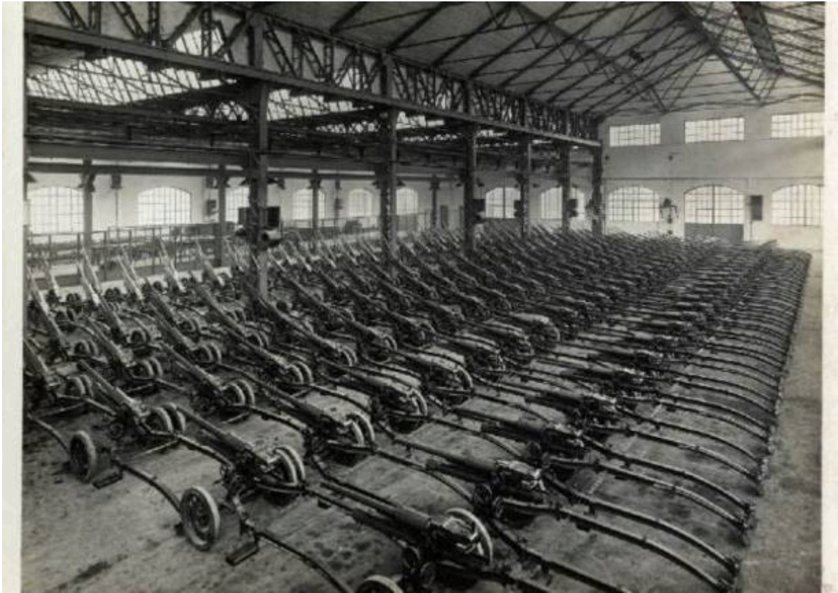
I capannoni della Cemsa pieni di cannoni anticarro da 47mm

Il 3 a Saronno incrociano le braccia anche gli operai della Sama, intanto lo sciopero nell'Italia del Nord è al culmine.